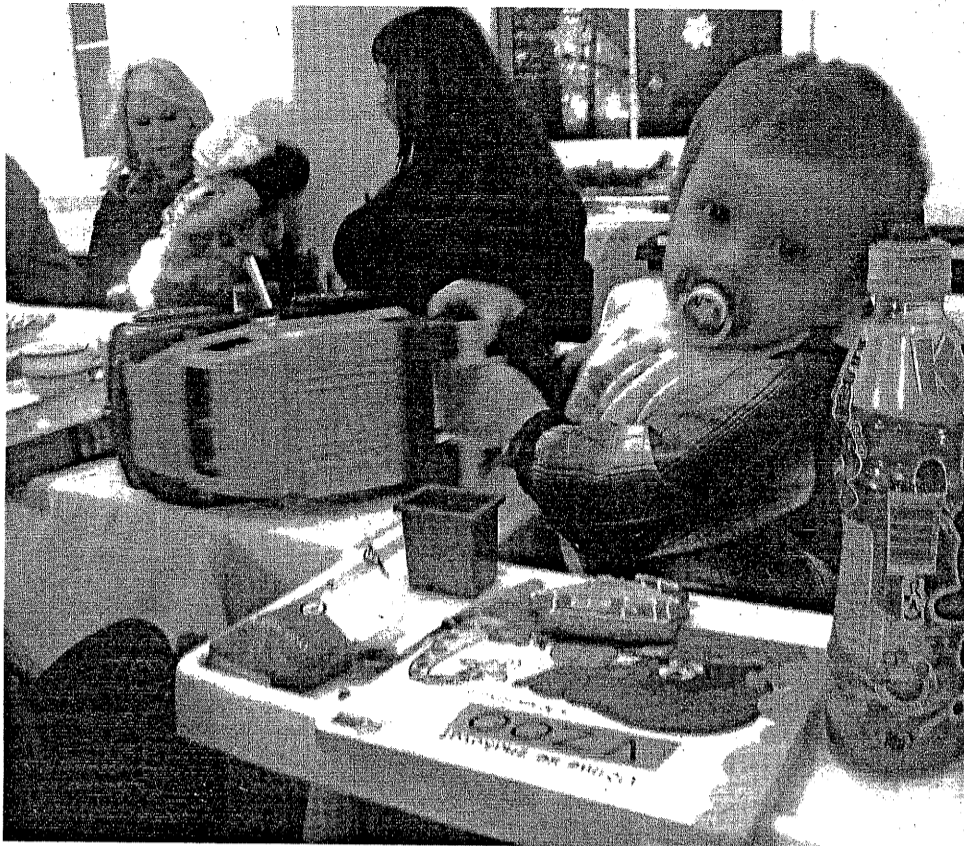
V AZYLOVÉM domě sv. Josefa v Lochovicích najdou útočiště rodiny, které přišly o střechu nad hlavou.

Klientů ubytovaných v Azylovém domě se během roku vystřídá přes jedno sto. Ne vždy se povede, aby se ro-