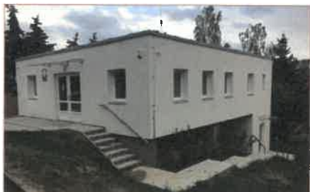
DC pro osoby bez přístřeší v Hořovicích

Začátkem roku došlo k doplnění personálu, což přispělo ke stabilizaci celého týmu. Provoz služby byl však ovlivněn pandemií onemocnění Covid-19, a během roku jsme několikrát měnili provozní dobu a pravidla užívání služby s ohledem na daná opatření.