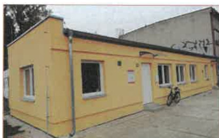
DC pro osoby bez přístřeší v Berouně

Výhled do budoucna: Rádi bychom pracovali opět v běžném provozu bez omezení.