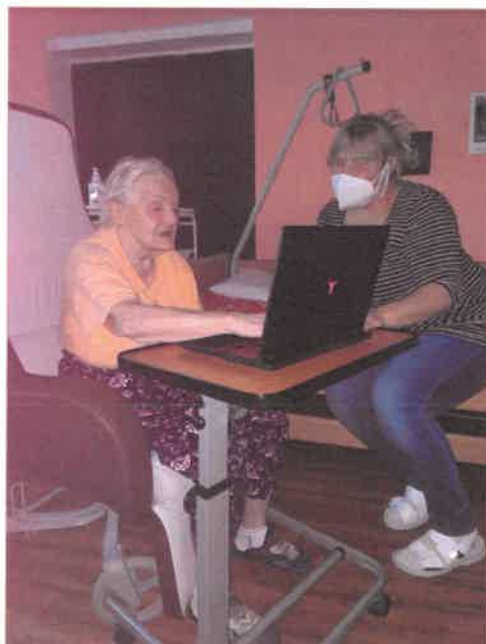
Notebooky - dar pro klienty DZR

V roce 2020, který byl poznamenán především příchodem pandemie, nás potěšilo, kolik organizací, jednotlivců a dobrovolníků bylo ochotno pomáhat a v rámci jejich i našich možností se zapojit do chodu Domova.