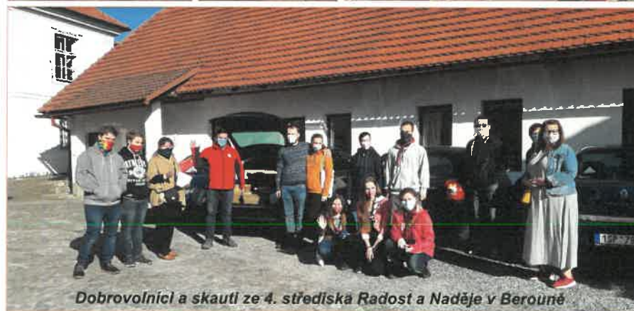
Dobrovolníci a skauti ze 4. střediska Radost a Naděje v Berouně