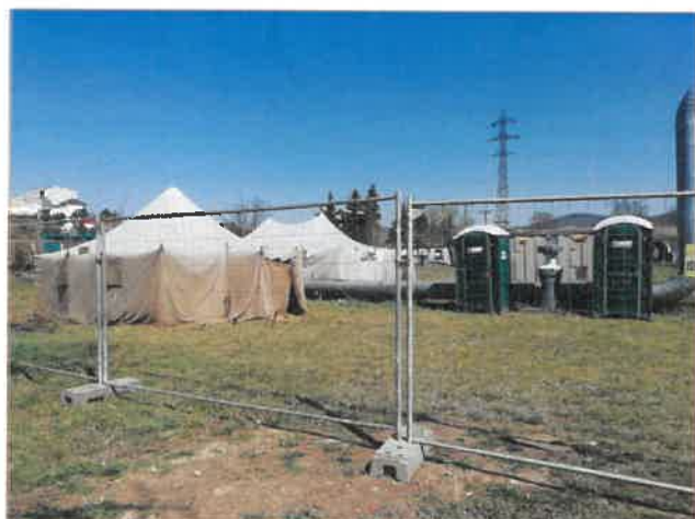
Stany postavené u Denního centra v Berouně postavené na jaře pro osoby bez přístřeší nakažené koronavirem

Služba je provozována od 18.00 do 9.00 hodin následujícího dne. Příjem uživatelů probíhá od 18.00 do 20.00 hod.