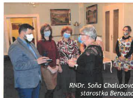
RNDr. Soňa Chalupová starostka Berouna