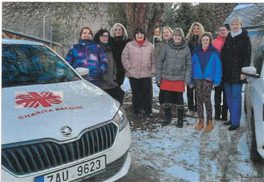
Tým terénní pečovatelské služby