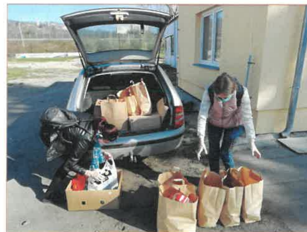
Tým sociální rehabilitace

I po odchodu vedoucí služby se nám podařilo udržet stávající kvalitu služby a doplnit tým o nové zaměstnance. Služba se během roku začala pomalu rozvíjet. Služba začala působit i na Hořovicku a došlo i k nárůstu počtu uživatelů. Těší nás rozvoj této služby, ve které stále vidíme větší potenciál.