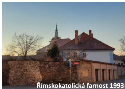
Římskokatolická farnost 1993